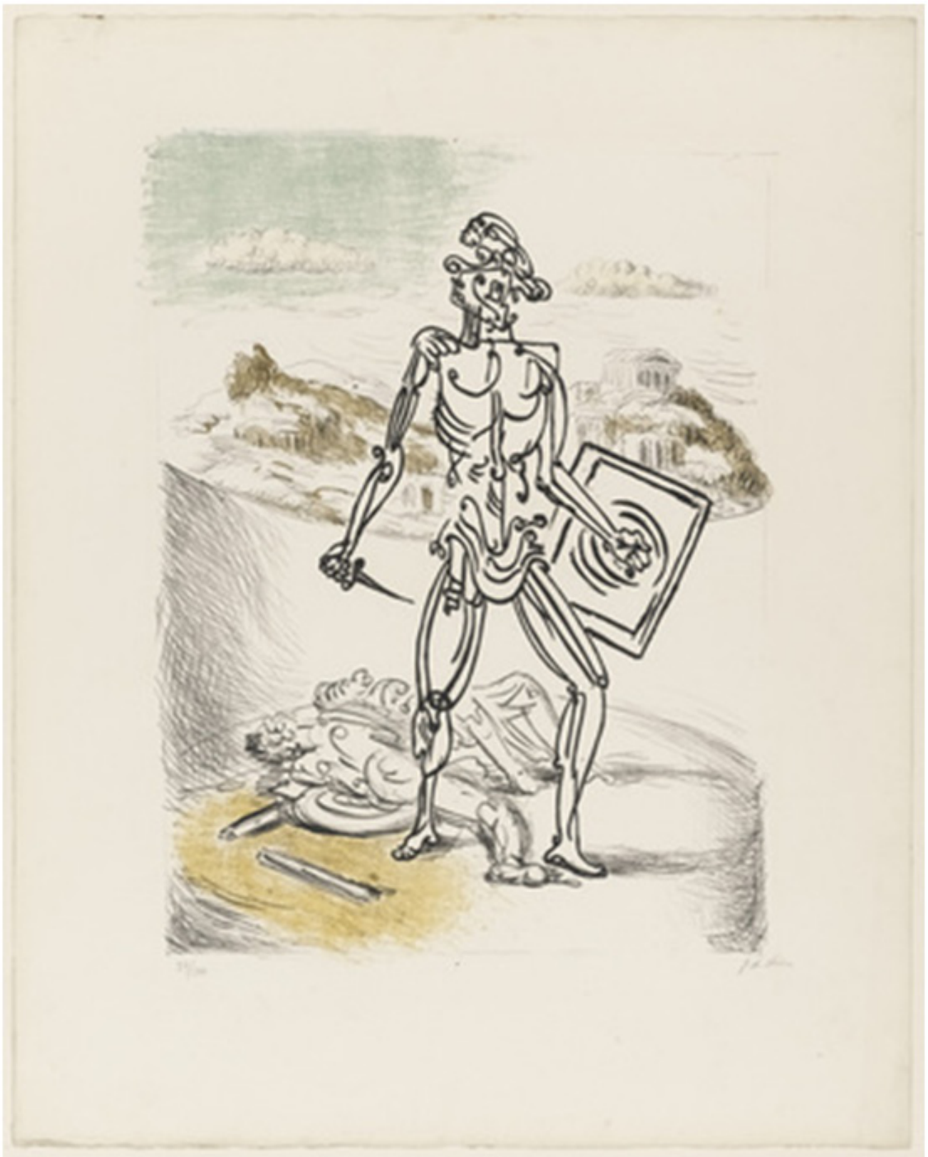
Ilustracja 3. Giorgio de Chirico Gladiator . Załącznik do zadania dla grupy II