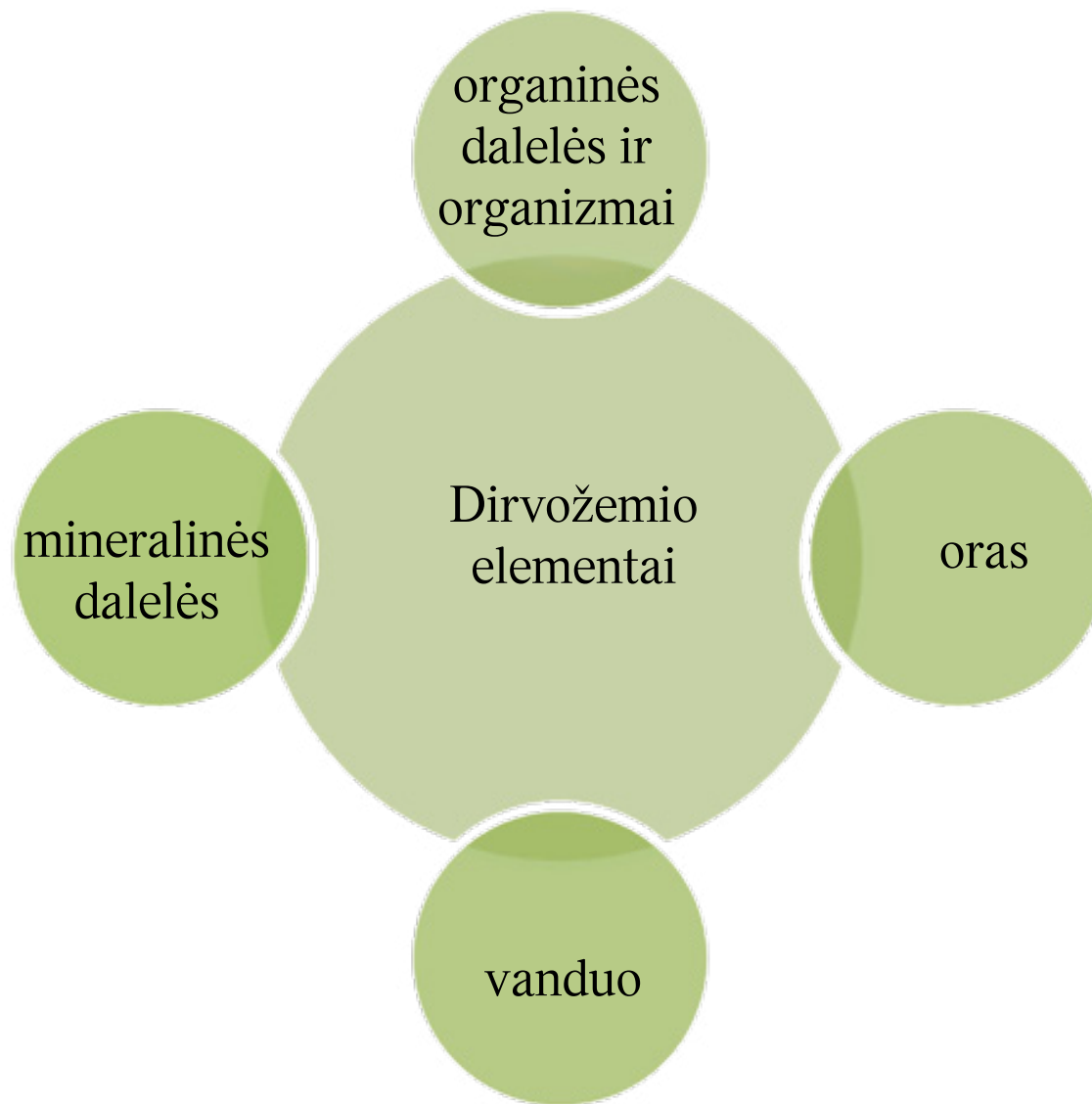
Dirvožemį sudarantys elementai